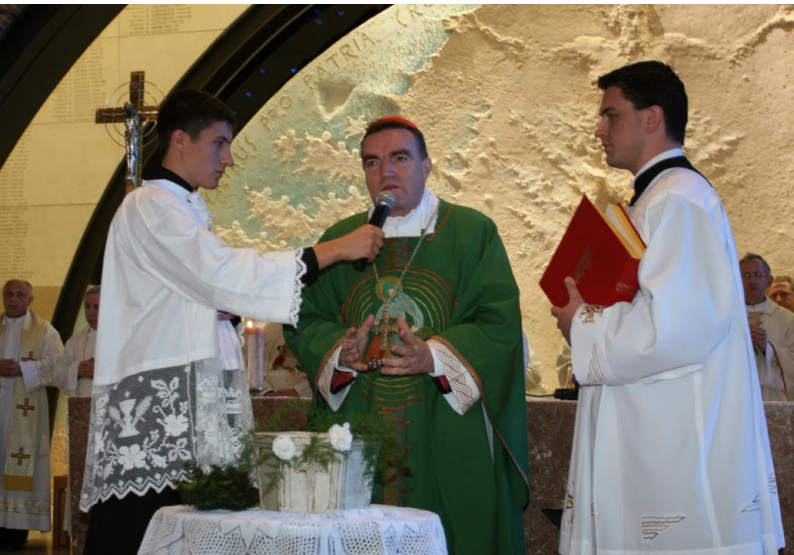
ZAGREB, SVETA MATI SLOBODE, 4. studenoga 2007.