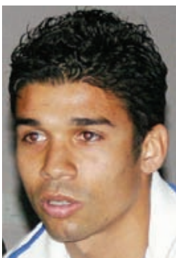
● Eduardo da Silva , nogometaš

P oručujem mladima da treba uvijek ići naprijed. Isto želim reći da mi je drago da se promovira sport, kako individualni tako i kolektivni. Kolektivne sportske discipline temelje se na zajedništvu – zahtijevaju da svi budu jedan uz drugoga. Tako je lakše doći do cilja, lakše je podnijeti poraz, bolje se veseli kad se pobjeđuje. Prema tome, mislim da nama u našoj zemlji, a to trebaju promicati sportaši, trebaju ljudi dobre volje, treba nam više zajedništva, trebaju nam dobri ljudi. Apsolutno se protivim negiranju morala, etike i svih drugih ljudskih vrijednosti, na kojima dapače trebamo insistirati i koje su, po meni, jedina budućnost koja nema alternative.«