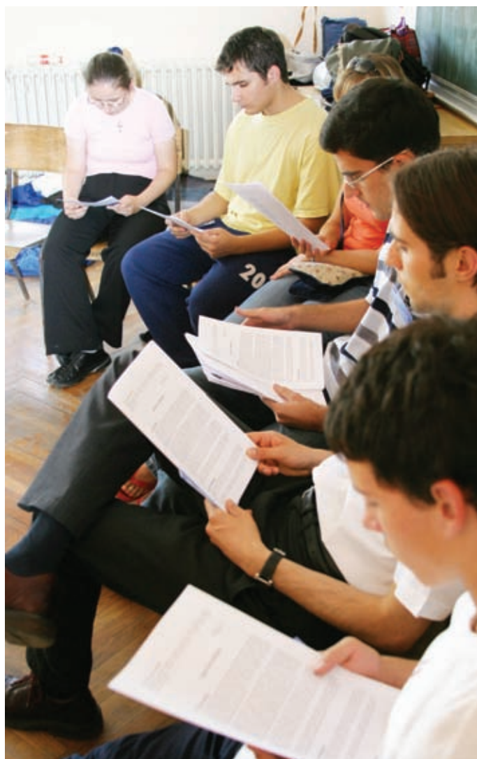
● Radni listovi velika su pomoć u svakoj predsinsodskoj raspravi

Sa svrhom animiranja Sinode organizirana su i školska natjecanja za vjeroučenike osnovnih i srednjih škola na