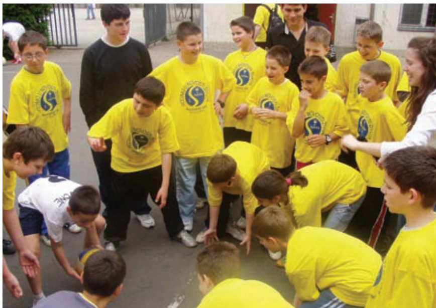
● Ministranti su na susretu ministranata grada Zagreba sudjelovali i u kvizu o Sinodi