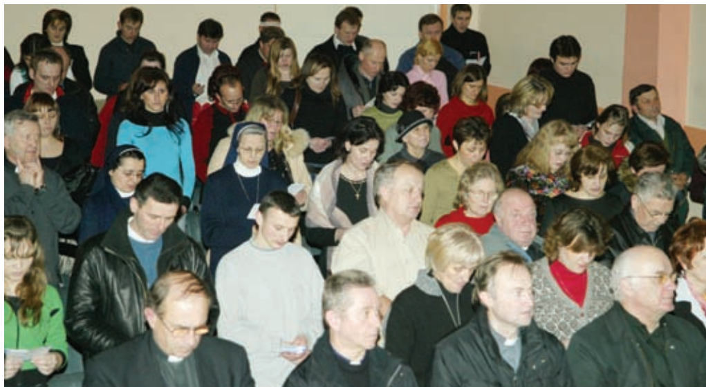
● Prvi susret na području pojedinih arhiđakonata održan je u Bjelovaru

Zaključak je dosadašnjih susreta da cilj i smisao pred-sinodskih rasprava nije i ne smije biti »odraditi« rasprave, napisati i poslati zapisnike. Glavni i osnovni cilj od kojeg sve treba krenuti jest obnova vjere i zajedništva u župnim zajednicama i na svim drugim razinama. Iz rasprava treba izvući korist za samu župu i taj moto treba voditi i usmjeravati sve. Samo tako će se moći reći da su pred-sinodske rasprave zapravo »male župne sinode«, forumi vjernika na kojima se uči, upoznaje, razgovara, surađuje, uočava konkretne situacije i traži rješenja, a zaključci koji se potom dijele sa Tajništvom za pripremu Sinode postaju vrijedni za cijelu Nadbiskupiju. ■