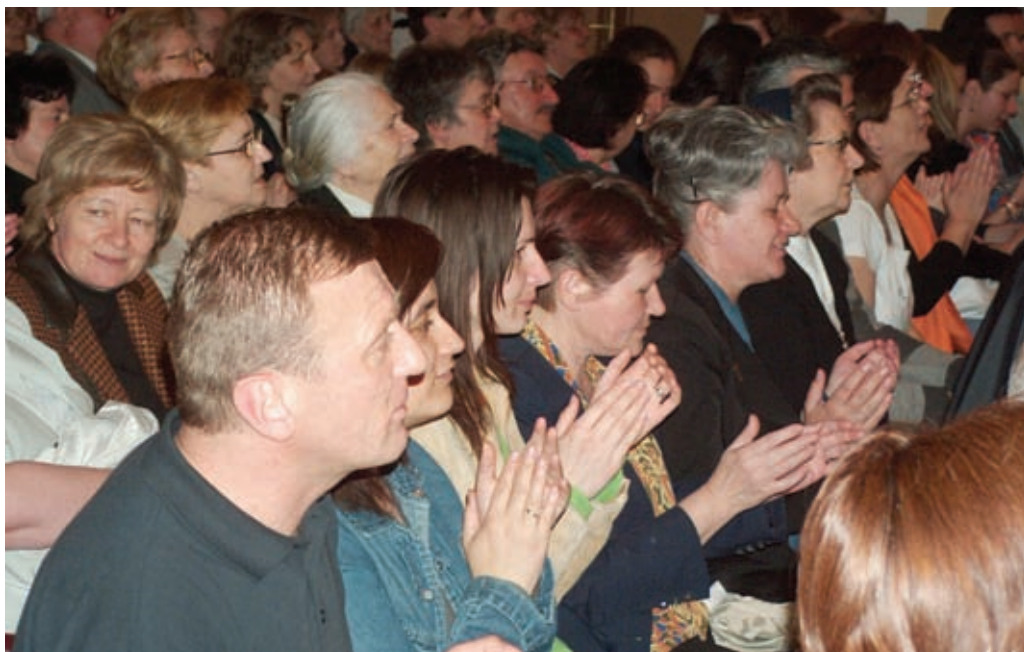
● Udruge i pokreti iskazali su spremnost na još bolju suradnju

apostolski dar, želja za evangelizacijom i evangelizatorskim djelovanjem. Papa Ivan Pavao II. rekao je 1998. godine članovima crkvenih pokreta: 'Vi ste novi evangelizatori!' To je zahtjev upućen i našim pokretima gdje se ta nova evangelizacija prepoznaje u vama, članovima duhovnih pokreta«.