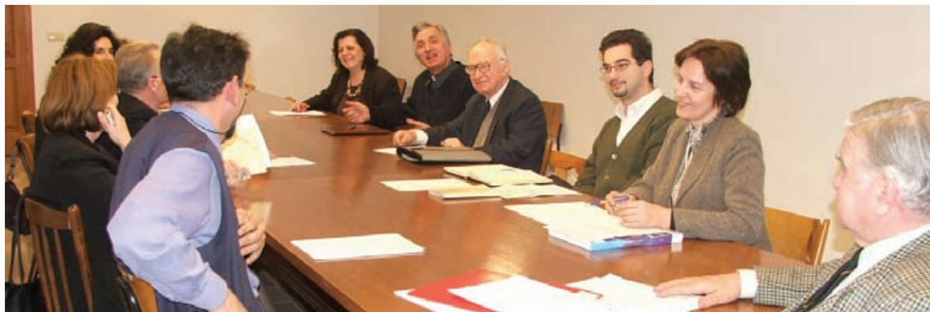
● Djelatnici u pastoralu obitelji također su održali predsinodske rasprave

Susreti djelatnika u obiteljskom pastoralu i euharistije za obitelji i obiteljski pastoral u gradu Zagrebu se održavaju, kada je to prikladno, prve srijede u mjesecu. U mjesecu travnju i svibnju ti susreti bili su povezani s predsinodskim raspravama, a ujedno su bili otvoreni svima zainteresiranima. 7. lipnja bit će završni susret obitelji i suradnika za ovu pastoralnu godinu. ■