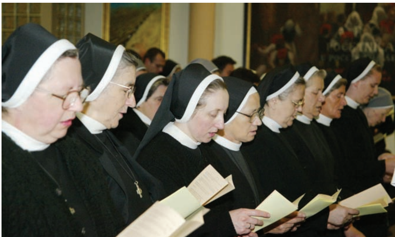
● Posebno su redovnice, redovnici, svećenici, ali i vjernici pozvani na predanu molitvu za uspjeh Sinode

susret smatramo uspješnim. Nastojale smo razviti konstruktivnu suradnju, kako bi on bio što plodonosniji. Ljudi smo ograničenih sposobnosti i mogućnosti da izrekemo jasno onako kako osjećamo i mislimo da bi trebalo, te često ostajemo nedorečeni. No, ono što ne možemo mi, može Onaj kojega neprestano molimo da svog Duha pošalje Crkvi, te je – kao na prve Duhove – zapali ognjem ljubavi i revnosti. Neka u našoj Crkvi ponovi događaj prve Pedesetnice, te i suvremeni pogani mognu reći: gledajte kako se ljube. Dođi, Gospodine, Isuse!« ■