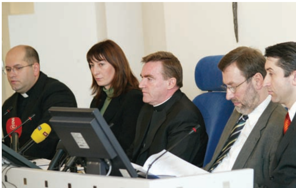
● Na konferenciji za novinare prikazano je ono što je dosada učinjeno u pripremnom razdoblju same Sinode

svi članovi Sinode imaju isti glas i nema razlike između laičkog i svećeničkog stala. »Kada se nešto izglasava, svaki glas ima istu vrijednost«, ustvrdio je kardinal Bozanić. »Ono što predlaže Sinoda treba prihvatiti nadbiskup koji ima pravo modificirati prijedloge. Onoga časa kada nadbiskup propiše prijedlog, on postaje mjerodavan za tu Crkvu. Ono što Sinoda predlaže, postaje smjerodavno kada to prihvati nadbiskup«, rekao je kardinal, dodavši kako je nadbiskup pozvan odgovorno razmatrati i slušati ono što govori glas Sinode. »Teško može doći do situacije gdje on treba postupiti drugačije od Sinode, a ako to i učini, onda to treba obrazložiti«, istaknuo je kardinal ustvrdivši kako ne može znati o čemu će Sinoda raspravljati jer »kada dođe do rasprave, ona je slobodna i ne znamo što će iz nje izići. To moramo prepustiti djelovanju Duha Svetoga«, rekao je kardinal Bozanić odgovarajući na pitanje postoji li mogućnost da Sinoda donese odluku o osnivanju nove biskupije u sklopu Zagrebačke metropolije. ■