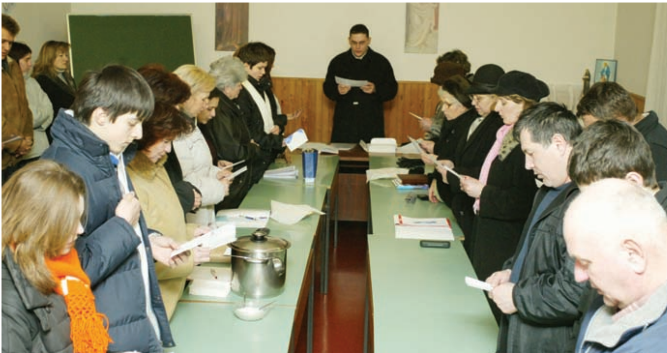
● Svaka predsinodska rasprava započinje molitvom za uspjeh Sinode